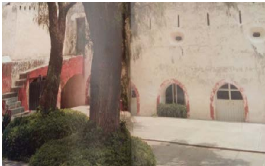
Fotografía 5. Interior de la Casa del Perdón, hoy centro cívico.