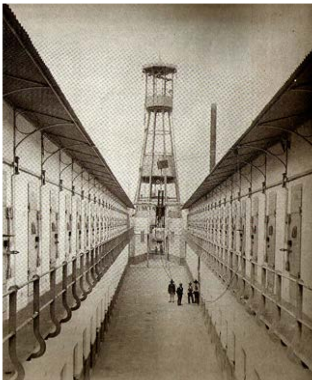
Fotografía 3. Galería del Palacio de Lecumberri, Archivo General de la Nación

Fuente: Fotografía citada por Adam David Morton en The fear of the power of the State , 2013.