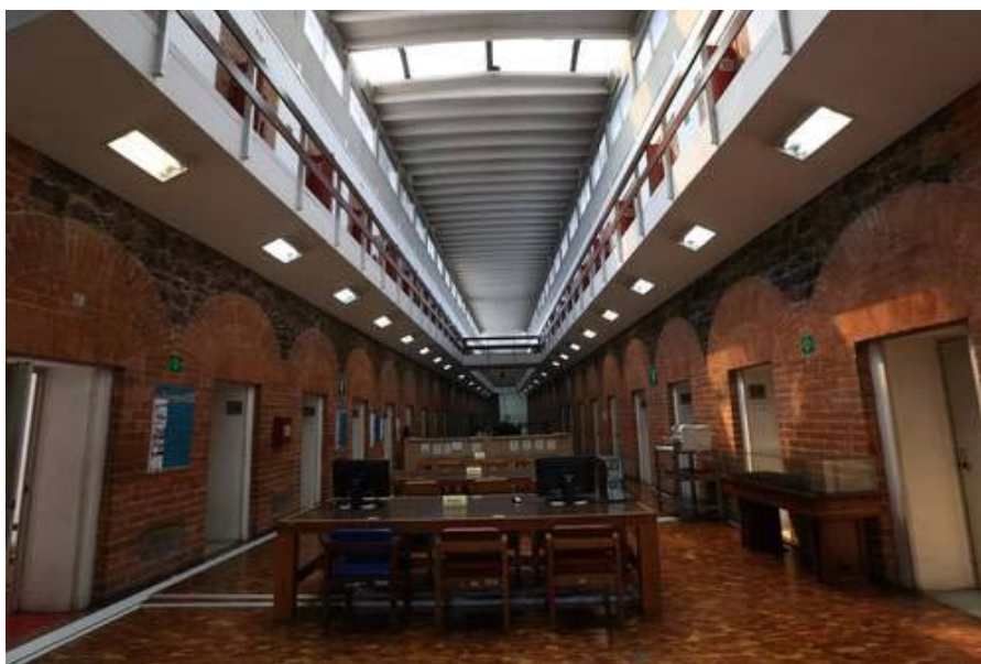
Fotografía 4. Interior del Palacio de Lecumberri, Archivo General de la Nación

Fuente: Fotografía citada por Adam David Morton en The fear of the power of the State , 2013.