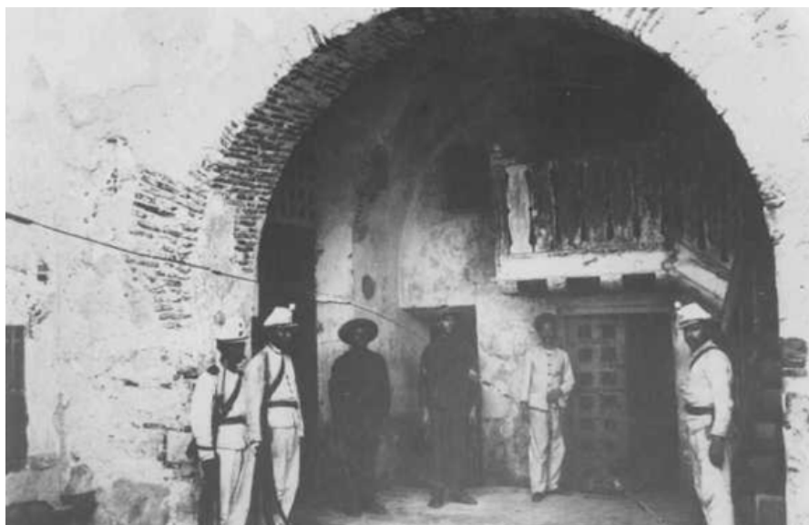
Fotografía 1. Entrada al baluarte de Santiago, una de las bodegas utilizadas como cárceles antes de 1910.

Esta transformación también se dio en la utilización de los espacios, como puede apreciarse en las siguientes fotografías, las bóvedas que fueron utilizadas como calabozos en el Porfiriato, actualmente son espacios de atracción para los turistas que visitan este espacio.