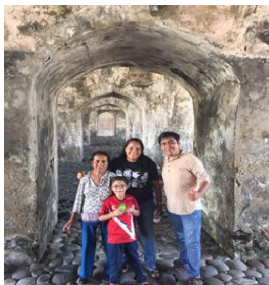
Fotografía 2. Bóveda de San Juan de Úlua como centro turístico.