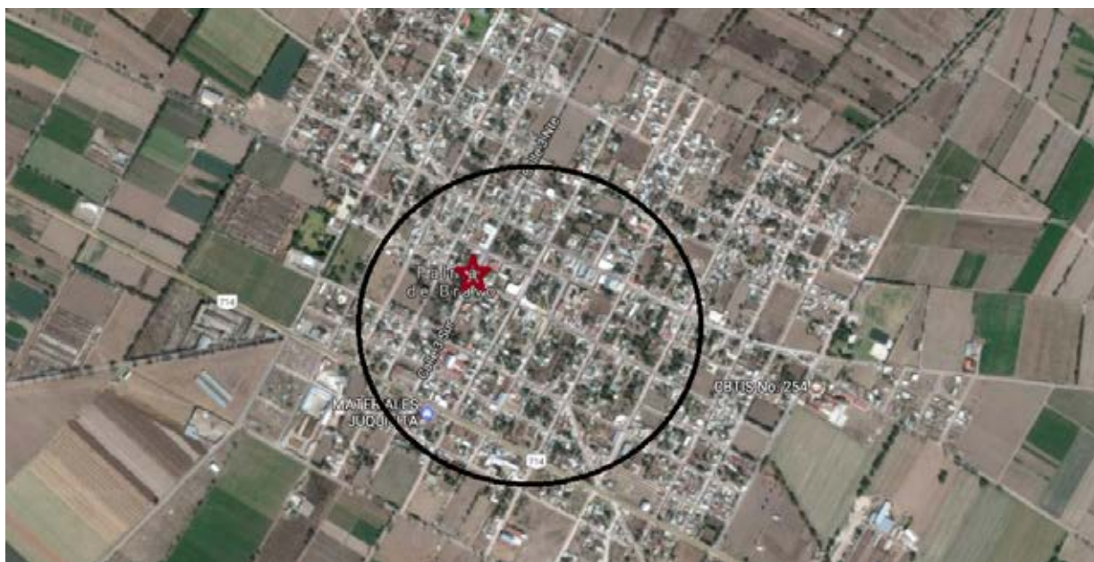
Fotografía Aérea 3. Ubicación de la Casa del Perdón en el poblado de Palmar de Bravo, Puebla

Al ser apropiado por los ejidatarios el espacio fue utilizado como un centro de reunión, los antiguos calabozos se convirtieron en salones de juntas, depositarios de archivos y hasta salones de instrucción. La reconversión del sitio se dio mediante la apropiación de los actores sociales, la incorporación en su imaginario colectivo y la transformación de la imagen social del inmueble.