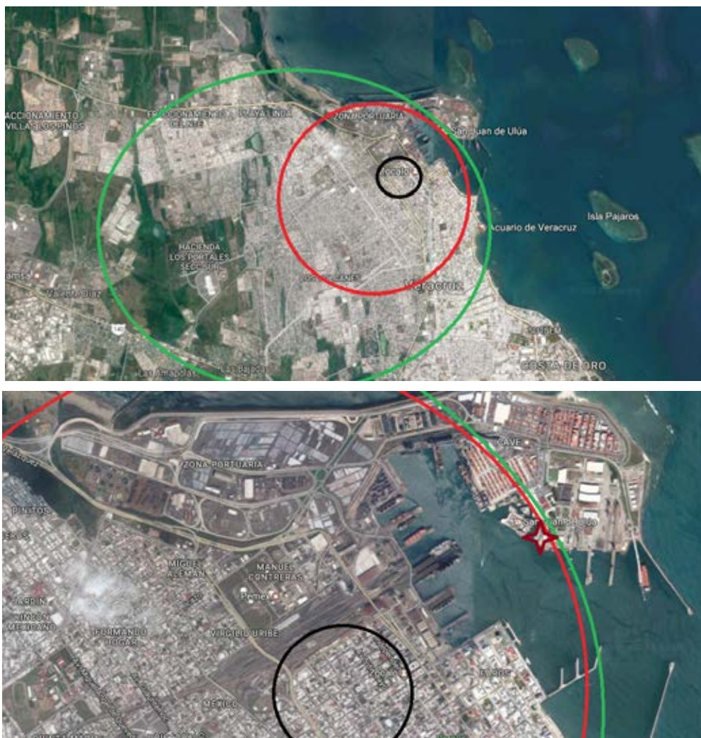
Fotografía Área 1. La ubicación de San Juan de Ulúa en el Puerto de Veracruz, México