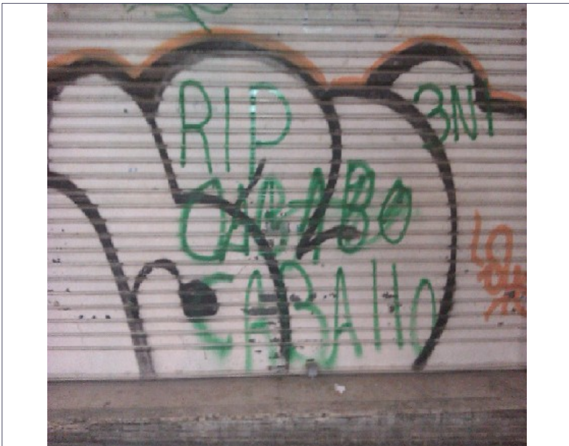
Fig. 3. Graffiti "RIP Caballo" alusivo a la muerte de un líder Trinitario de la República Dominicana Plaza Santa Maria Magdalena de Lleida, febrero 2012.