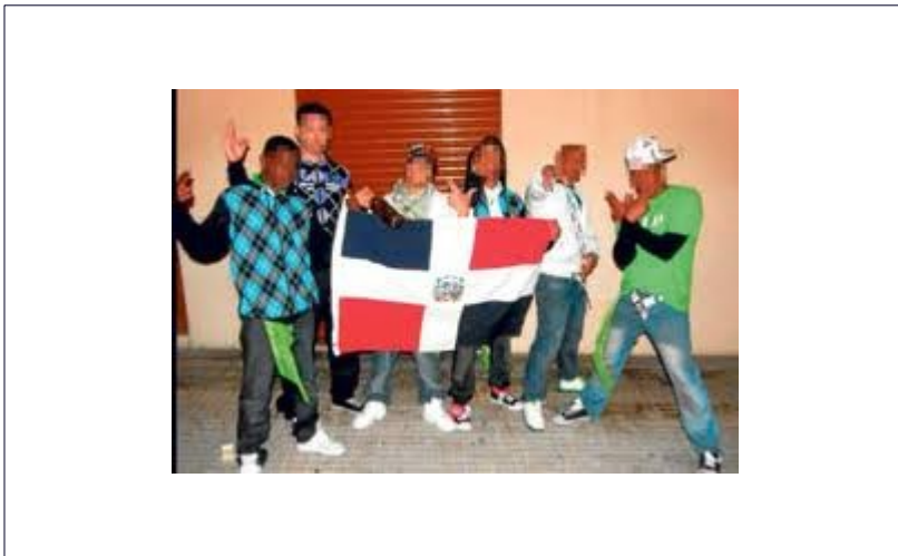
Fig.2. Varios miembros de Los Trinitarios.